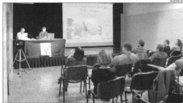
Una imatge de l'edició anterior de les jornades.

L'eix central de les jornades d'enguany serà analitzar la direcció que està agafant l'exercici de la professió liberal a Andorra. Des de la SAC posen en relleu que avui, més que en cap altre moment, cal confiar en les capacitats de la "complexa so-